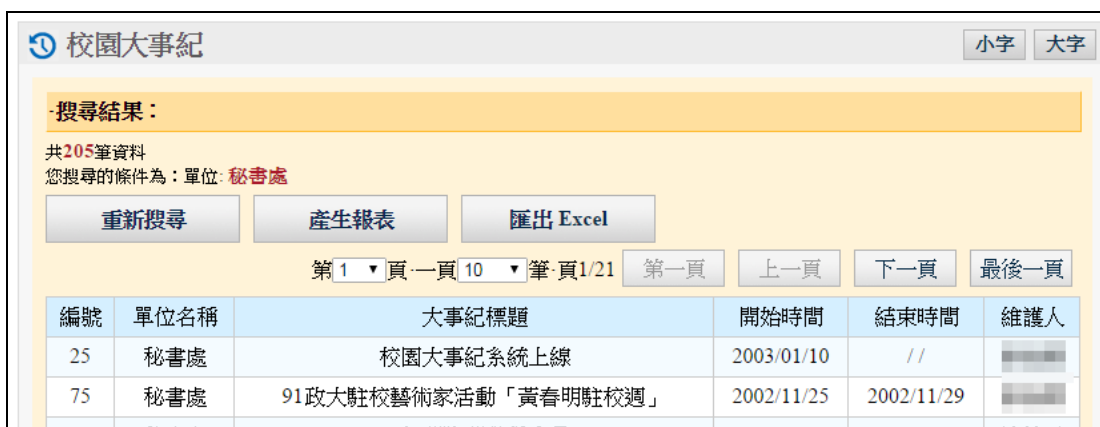
圖 4-4 查詢結果