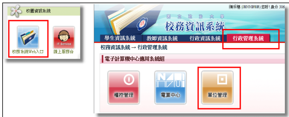
圖 2-1 校務系統 web 入口