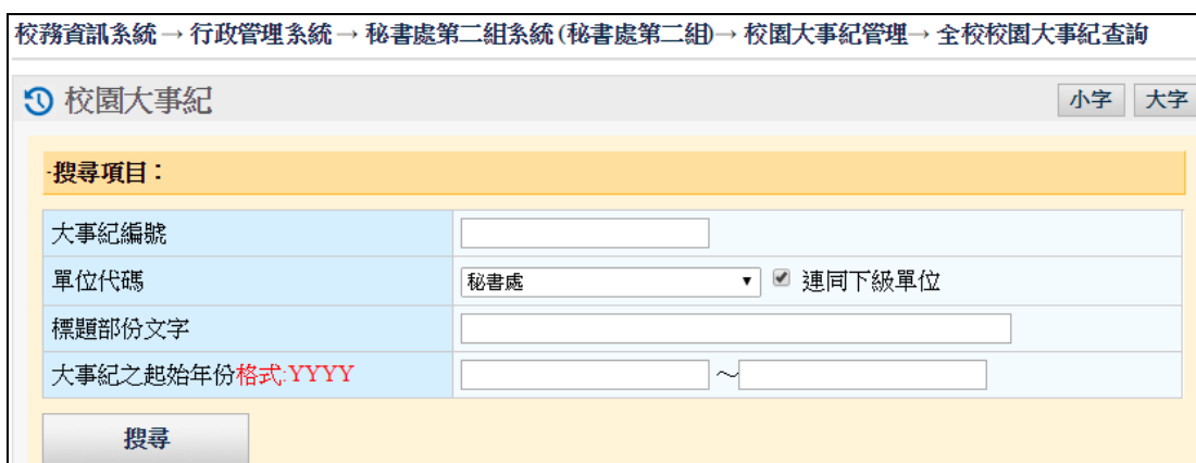
圖 4-3 全校校園大事紀查詢