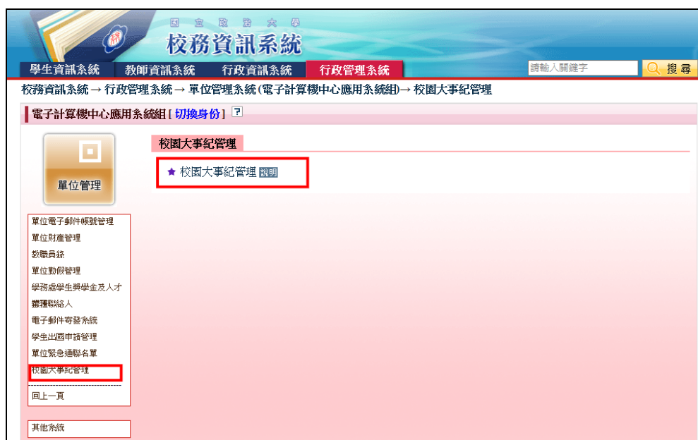
圖 2-2 校園大事紀管理