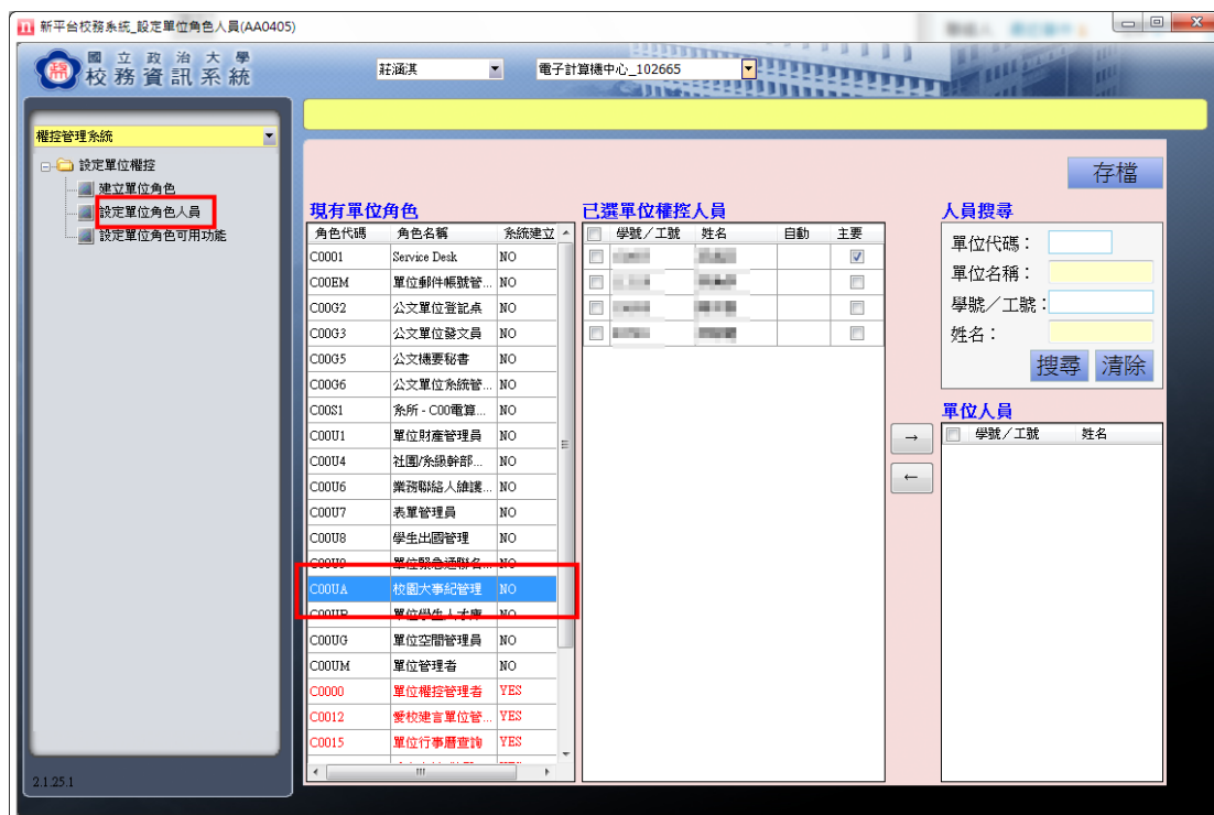
圖 8-1 各單位「校園大事紀管理」權限